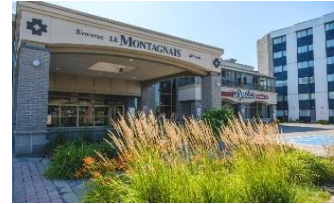
Hôtel Le Montagnais

7h00 Petit-Déjeuner à l'hôtel. 9h30 Visite et démonstration chez Touverre de La Baie. 11h15 Visite du musée de la Petite Maison Blanche de Chicoutimi. 12h45 Fin de la visite et départ pour le retour vers votre région. 2 arrêts en chemin de 30 mins chaque 21h00 Arrivée approximative à Ste Thérèse 21h30 Arrivée approximative à Laval