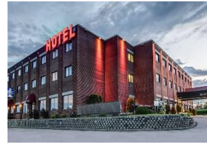
Hôtel Château Roberval